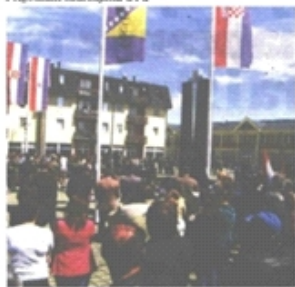
Izaslanstva položila vijence ispred spomen-obilježja u ulici

Vijencem Posavine Prigodnim sadržajima u i u